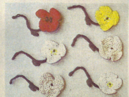
Gestrickte Blüten zur Auswahl