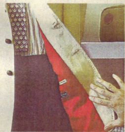
Jackett rot gefüttert