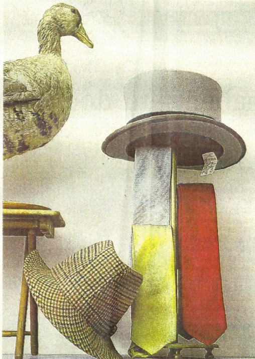
Very british: Hüte und Krawatten